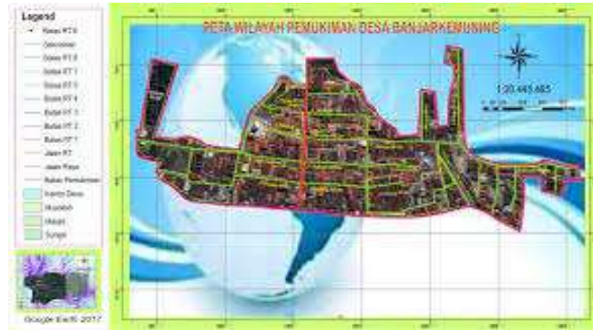
Gambar 1. Peta Desa Banjar Kemuning

Batas-batas Desa Banjar Kemuning Kecamatan Sedati Kabupaten Sidoarjo sebagai berikut: