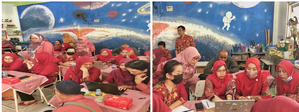
Gambar 2. Kegiatan Pengenalan Beberapa Jurnal Berbasis OJS

Selanjutnya, acara inti yaitu penyampaian pemateri. Materi yang disampaikan terkait publikasi karya ilmiah mulai dari tahapan persiapan publikasi, teknik penyusunan artikel siap terbit di jurnal nasional, dan pendampingan intensif publikasi ilmiah berbasis OJS. Penyampaian materi dilakukan secara komprehensif sehingga memudahkan peserta memahami materi. Kegiatan berlangsung secara interaktif sehingga memungkinkan peserta untuk berinteraksi langsung dengan pemateri. Setelah berlangsung selama sekitar 2 jam lamanya, kegiatan dilanjutkan dengan diskusi dan tanya jawab.