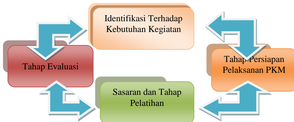
Gambar 1. Tahap Pelaksanaan Kegiatan Pengabdian Kepada Masyarakat