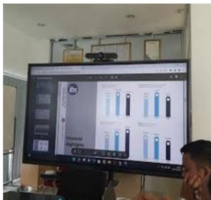
Gambar 3. Tahap Penyampaian Materi