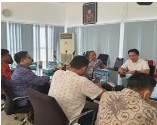
Gambar 2. Tahap Penyampaian Materi