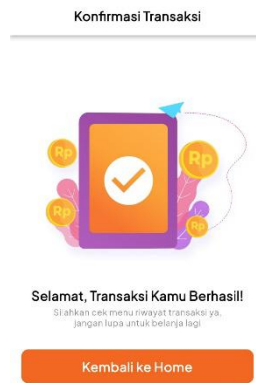
Gambar 7. Transaksi Berhasil