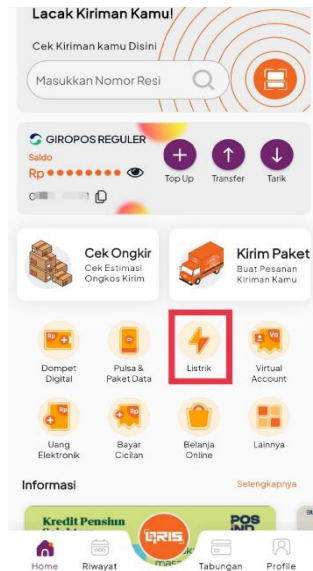
Gambar 3. Menu Utama