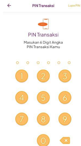
Gambar 6. Sandi