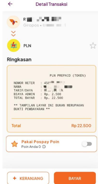
Gambar 5. Detail Transaksi