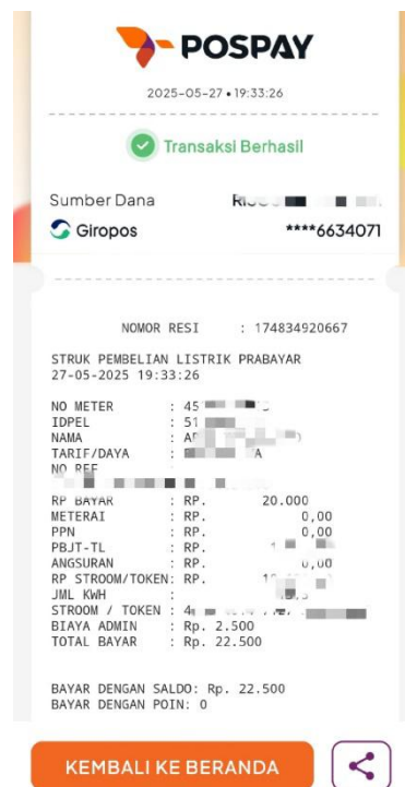
Gambar 8. Bukti Transaksi

Setelah berhasil membayar, aplikasi akan menampilkan bukti pembayaran digital. Bukti akhir pembayaran akan menampilkan IDPEL yang digunakan pengguna untuk mengisi token listrik.