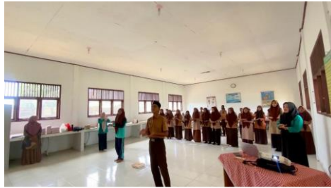
Gambar 2. Kegiatan Edukasi Kebersihan Diri Anak di SMPN 1 Seuneuddon

menular, terutama untuk anak-anak kecil di sekolah dasar. Kebersihan tangan dianggap sebagai komponen penting dari pengendalian infeksi. Dampak cuci tangan pada prevalensi penyakit pernapasan, menyatakan bahwa intervensi mencuci tangan yang tepat dapat memutus siklus penularan dan mengurangi risiko sebesar 6% hingga 44%. Kebersihan tangan yang memadai sangat mencegah penyebaran infeksi saluran cerna dan pernapasan terutama pada anak-anak. Mencuci tangan menggunakan sabun dapat mencegah infeksi ini dan dapat mengurangi ketidakhadiran siswa di sekolah.