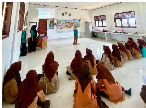
Gambar 3. Kegiatan Edukasi Kebersihan Diri Anak di SMPN 1 Seuneuddon