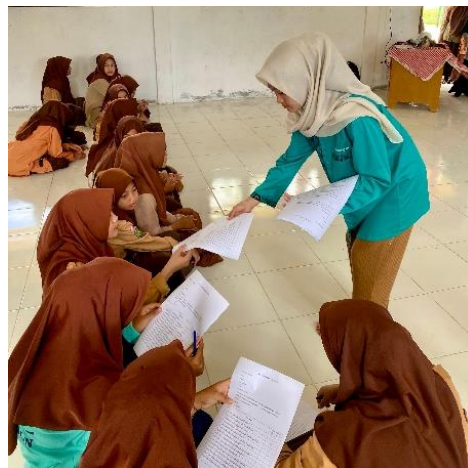
Gambar 4. Kegiatan Edukasi Kebersihan Diri Anak di SMPN 1 Seuneuddon

Pengetahuan juga merupakan salah satu faktor untuk membentuk sikap anak dan juga melalui promosi kesehatan yang terdapat di sekolah akan lebih mendukung dan membentuk anak menjadi siswa yang berkarakter menjaga hidup bersih dan sehat. Namun