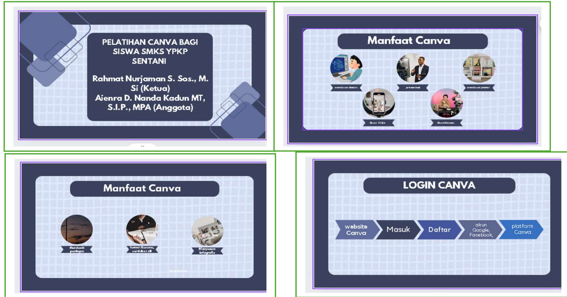
Gambar 2 : Materi, Praktek Simulasi Dan Modul Pengabdian

Kegiatan pengabdian dilaksanakan pada tanggal 1 Juni 2024 dan dihadiri oleh 30 Siswa. Sebelum kegiatan dilaksanakan, tim terlebih dahulu membagikan lembar pre-test untuk memperoleh informasi tentang kemampuan awal peserta dalam menggunakan Canval. Pre-test dan post-test memiliki satu tujuan yaitu untuk mengukur Pengetahuan dalam menggunakan canva. Oleh karenanya, pernyataan pre-test sama dengan pernyataan post-test Kemampuan menggunakan Canva yang ditunjukkan sekedar untuk membuat dan menyimpan mengedit foto saja, tetaoi ini juga digunakan utuk membuat laporan presentasi, sehingga bisa dimanfaatkan sebagai media meningkatkan kreativitas siswa dalam belajar.