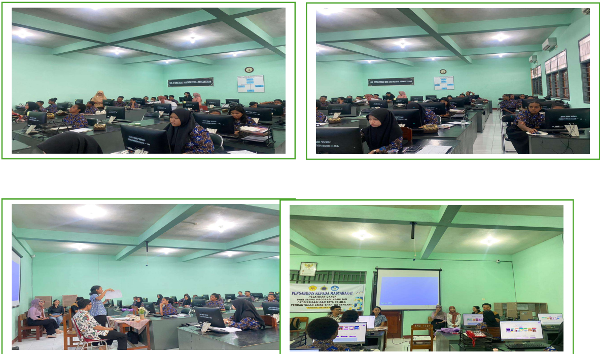
Gambar 4. Ceramah Praktek Simulasi

( catatan : Pendampingan Siswa SMKS YPKP SENTANI Pengenalan fitur Canva