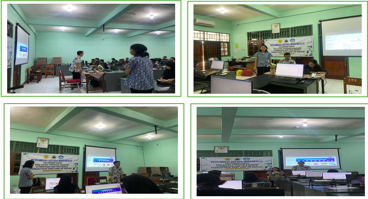
Gambar 3. Materi & Praktek simulasi Pendampingan Perlangkapan

( catatan : Pendampingan Siswa SMKS YPKP SENTANI Pengenalan fitur Canva