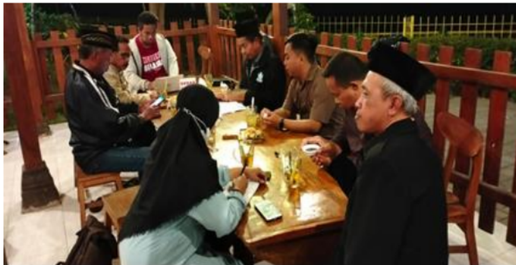
Gambar 3. Koordinasi pemantapan program pembuatan website BPKal Sumberadi

Pelaksanaan kegiatan pengabdian kepada masyarakat yang dilakukan di Kalurahan Sumberadi Kapanewon Mlati Kabupaten Sleman Provinsi Yogyakarta sejak 6 Maret 2024 sampai dengan 28 Mei 2024. Permasalahan prioritas yang disurvei dari wawancara ke warga desa sumberadi dan observasi yang dilakukan bersama BPKal Sumberadi dan analisis kebutuhan yang mendesak. Agenda pelaksanaan selanjutnya yang dilakukan tim pengabdian yaitu merencanakan program dan implementasi program penggunaan website dan pengelolaan website bagi warga masyarakat sumberadi.