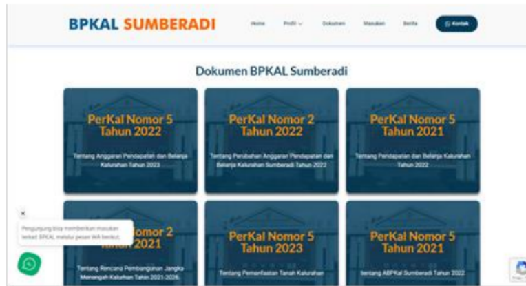
Gambar 6. Tampilan Publikasi Peraturan Kalurahan