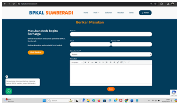
Gambar 7. Tampilan Sistem Aduan atau Masukan ke Desa

Selain itu juga dihasilkan luaran berupa berupa pelatihan pengelolaan website desa BPKal Sumberadi. Lebih jelas tentang 10 luaran dari usulan pengabdian dapat dilihat pada Tabel 1.