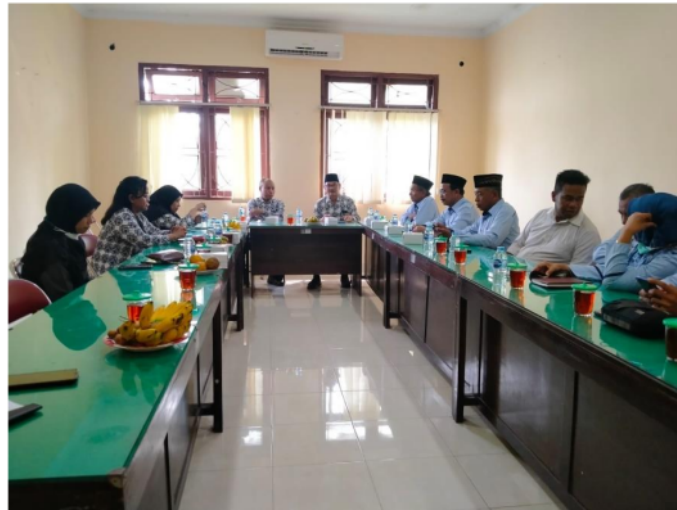
Gambar 1. Diskusi dengan pemerintah desa dan BPKal Sumberadi