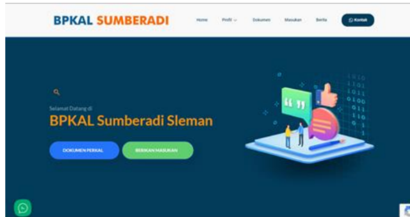
Gambar 5. Desain depan website bpkalsumberadi.com

pengabdian dan mitra (khususnya BPKal). Tim program pengabdian bertindak sebagai project leader pembangunan website BPKal. Sedangkan mitra dilibatkan untuk membantu dalam penggalian kebutuhan sistem dalam hal ini tampilan dan menu website yang akan disesuaikan dengan kebutuhan mitra.