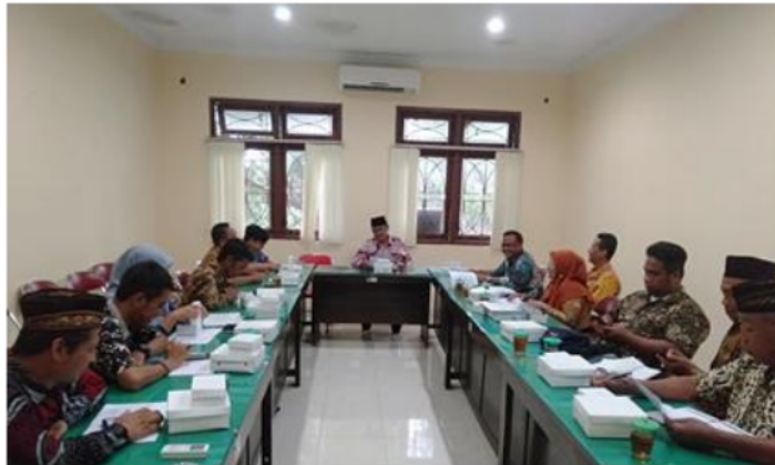
Gambar 8. Sosialisasi penggunaan website dalam rangka sosialisasi peraturan kalurahan dan mengisi aduan atau masukan ke desa

Tahap terakhir dari kegiatan pengabdian ini adalah melakukan evaluasi penilaian atas seluruh rangkaian kegiatan yang dilakukan. Secara umum, kegiatan terlaksana dengan baik dan lancar. Hal ini ditunjukkan dengan antusiasme peserta yang tinggi dalam mengikuti diskusi atau rapat koordinasi, serta berpartisipasi aktif dalam workshop pengelolaan website. Angket respon diberikan pada kegiatan pengabdian masyarakat di Anggota BPKal dan perangkat desa, untuk melihat sejauh mana respon terhadap kegiatan yang dilakukan.