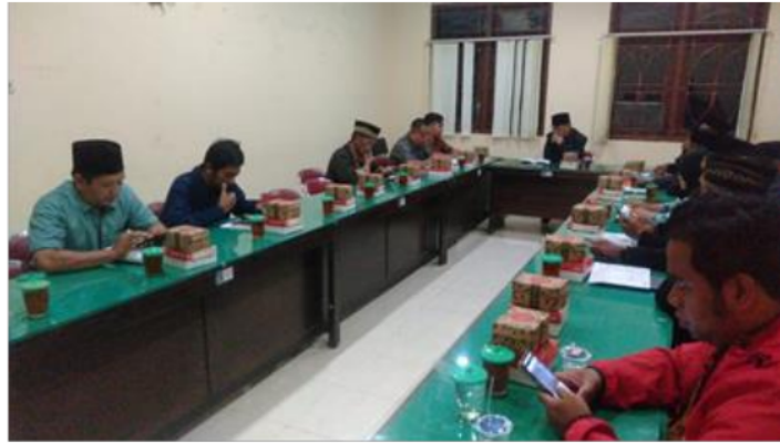
Gambar 4. Observasi dan Koordinasi dengan Perangkat Desa dan BPKal Sumberadi

BPKal Sumberadi ini sudah melibatkan peran dari pemerintah desa dan masyarakat dalam pengembangannya misalnya sebagai anggota dan pengurus dari BPKal Sumberadi. Pengelola website bpkal sumberadi dan penduduk di wilayah sumberadi pada umumnya, belum memahami betul mengenai peran website ini sebagai media informasi sehingga sampai saat ini belum banyak warga yang membuka website karena belum bisa mendapatkan pengalaman bagaimana cara menggunakannya.