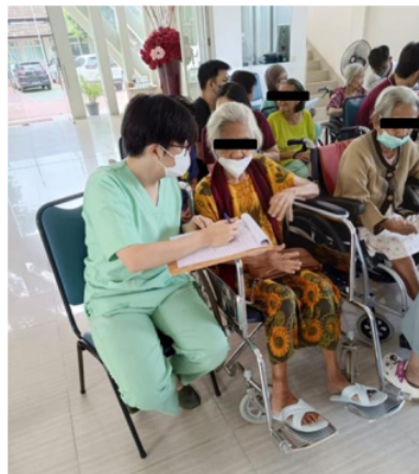
Gambar 1. Dokumentasi Kegiatan di Panti Werda Hana

Pelaksanaan kegiatan deteksi dini ini ditujukan kepada populasi lanjut usia di Panti Werda Hana, Tangerang Selatan. Kegiatan ini diikuti oleh 61 peserta, yang terdiri dari 14 orang laki-laki dan 47 orang perempuan. Peserta mengikuti rangkaian kegiatan di Panti Werda Hana (Gambar 1). Hasil karakteristik dan pemeriksaan tekanan darah (Tabel 1), Interpretasi hasil pemeriksaan tekanan darah (Gambar 2) dilampirkan. Berdasarkan klasifikasi hipertensi menurut JNC 7, didapatkan sebanyak 11 orang (18,03%) menderita hipertensi.