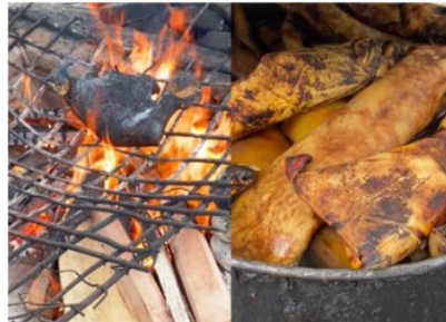
Gambar 4. Proses Pembuatan Kikil Lembu di UD. AGUS SITAH Kikil

Berdasarkan gambar 3 Survei lokasi UD. AGUS SITAH Kikil ternyata bertempat di Huta III Sakhuda Bayu, Simalungun. Dimana proses produksi Kikil Lembu dilakukan dibelakang rumah dengan tempat produksi yang bersih dan tradisional menggunakan kayu bakar untuk proses pembakarannya. Berikut gambar proses pembuatan Kikil pada UD. AGUS SITAH Kikil :