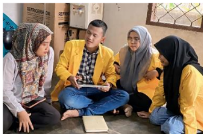
Gambar 5 : Proses Wawancara Dengan Pemilik Usaha

Berdasarkan gambar 5 proses wawancara berjalan dengan baik dan tidak terjadi keterhalangan komunikasi antara kami dengan pengusaha. Sehingga proses wawancara ini berjalan dengan baik dan lancar. Kami juga menanyakan tentang seputar usaha dan bahan baku