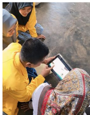
Gambar 7 : Tahap Pelatihan dan Pendampingan

Pada tahap ini, tentunya kami memberikan Pelatihan dan Pendampingan berupa Cara Menentukan Biaya Variabel, Menentukan Profitabilitas, dan Pengenalan laporan laba rugi untuk menghitung keuntungan yang valid agar operasional usaha ini berjalan dengan lancar untuk kedepannya.