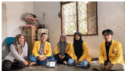
Gambar 6 : Pemberian Materi dan Bimbingan Untuk Tahap Pelatihan

Berdasarkan gambar 6 maka dapat diketahui pemberian materi berjalan dengan baik sesuai prosedur yang kami rencanakan dan pemilik UD. AGUS SITAH Kikil Lembu mampu memahami apa yang kami sampaikan. Adapun materi yang kami sampaikan pada kegiatan pengabdian masyarakat ini yaitu, pengertian biaya variabel, penentuan biaya variabel, tentang seputar profitabilitas, dan menghitung profitabilitas serta pengenalan laporan laba rugi.