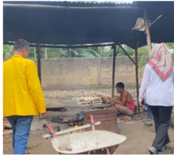
Gambar 3: Survei Lokasi UD. AGUS SITAH Kikil

Berdasarkan gambar 3 Survei lokasi UD. AGUS SITAH Kikil ternyata bertempat di Huta III Sakhuda Bayu, Simalungun. Dimana proses produksi Kikil Lembu dilakukan dibelakang rumah dengan tempat produksi yang bersih dan tradisional menggunakan kayu bakar untuk proses pembakarannya. Berikut gambar proses pembuatan Kikil pada UD. AGUS SITAH Kikil :