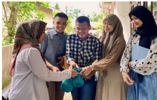
Gambar 9 : Pihak Kami Membeli Produk Kikil di UD. AGUS SITAH Kikil