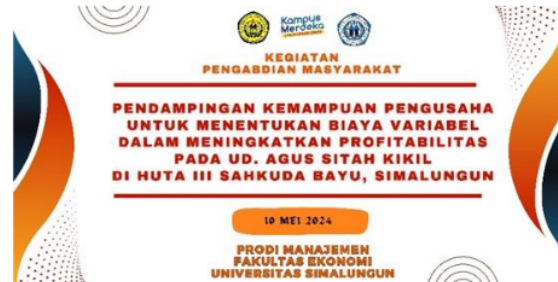
Gambar 2. Desain Spanduk Kegiatan PKM

Pada Tahap perencanaan ini kami melakukan perencanaan yang matang untuk apa saja yang akan diajukan dan dipertanyakan kepada si pengusaha serta menyusun persiapan penting apa saja yang akan dibawa ke tempat pengabdian masyarakat misalnya, pulpen, ipad, dan spanduk sebagai wujud perkenalan kami kepada pihak UD. AGUS SITAH Kikil Lembu . Berikut lampiran gambar pada tahap perencanaan sebagai berikut :