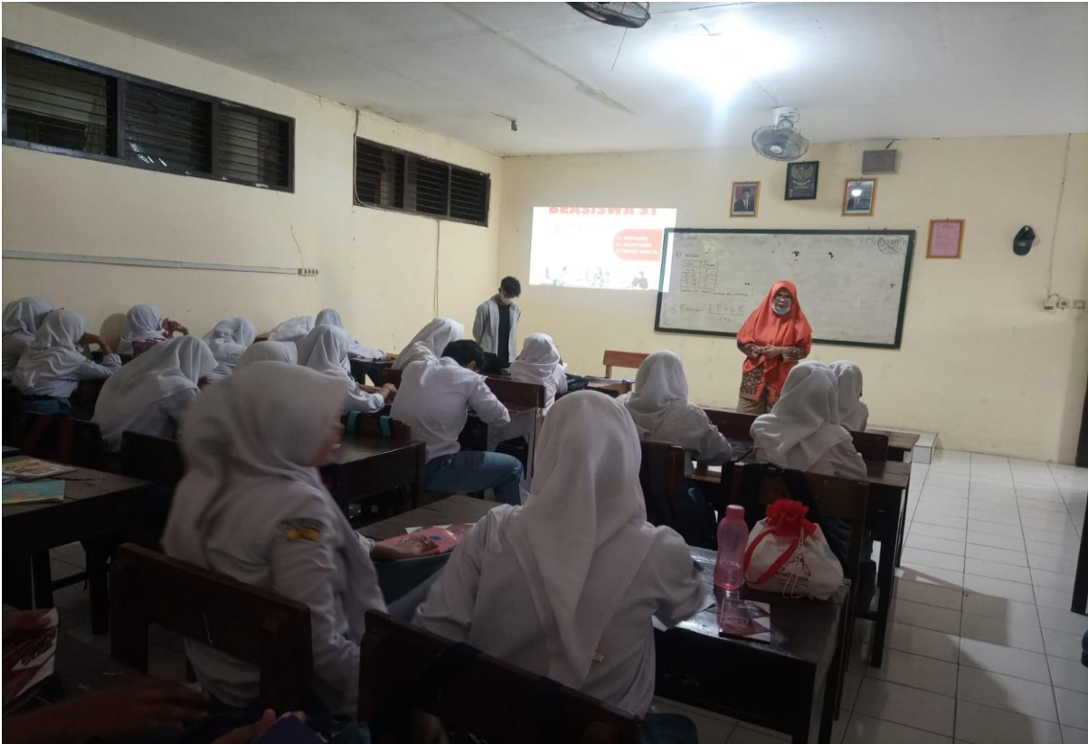
Gambar 3. Kegiatan Pre test