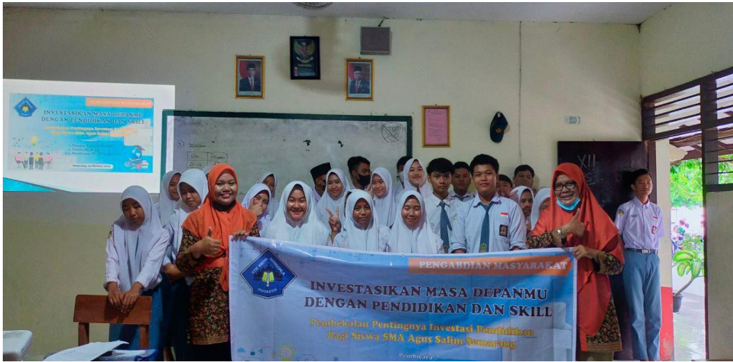
Gambar 1. Kegiatan Sosialisasi dan Pembekalan bagi Siswa SMA Agus Salim Semarang

Berikut tahapan pelaksanaan Sosialisasi dan Pembekalan Pentingnya Investasi Pendidikan Bagi Siswa Sma Agus Salim Semarang, dapat dilihat pada diagram di bawah ini: