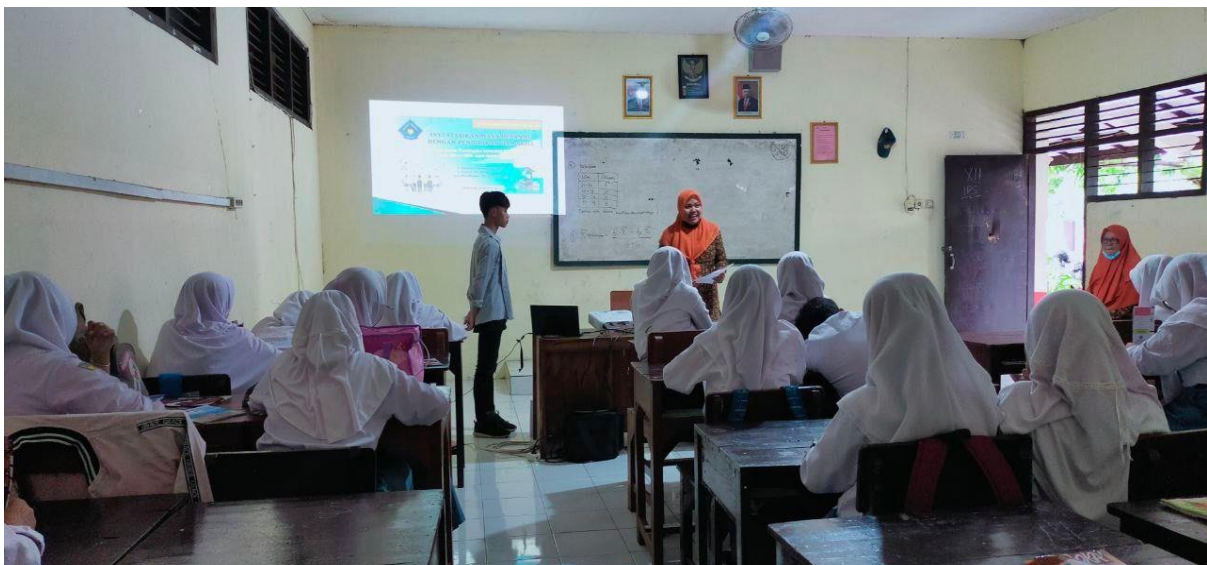
Gambar 4. Kegiatan pemaparan materi sosialisasi