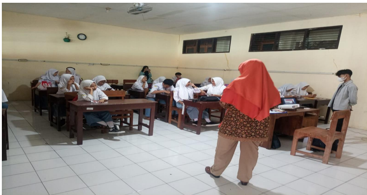
Gambar 5. Kegiatan Post test