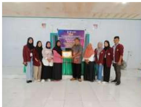
Gambar 4. Penutupan program pengabdian masyarakat

Dengan terselenggaranya kegiatan pengabdian kepada masyarakat ini, puji syukur kami panjatkan kehadiran Allah SWT, Alhamdulillah kegiatan ini berjalan dengan baik dan lancar. Antusias aparat desa bersama masyarakat terlihat nyata dengan hadirnya web desa bagi desa Oluhuta. Dengan hadirnya web desa ini diharapkan dapat mempercepat laju roda perekonomian masyarakat desa Oluhuta. disamping itu juga kegiatan pengabdian kepada masyarakat ini juga menerapkan kemajuan teknologi, sehingga dapat membantu pemerintah desa untuk membangun desa menuju desa mandiri. Kami berharap semoga dengan web desa ini permasalahan yang dihadapi desa dapat terselesaikan dan web desa ini dapat dikelola dengan baik.