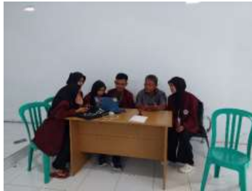
Gambar 3 . Penyusunan Informasi desa