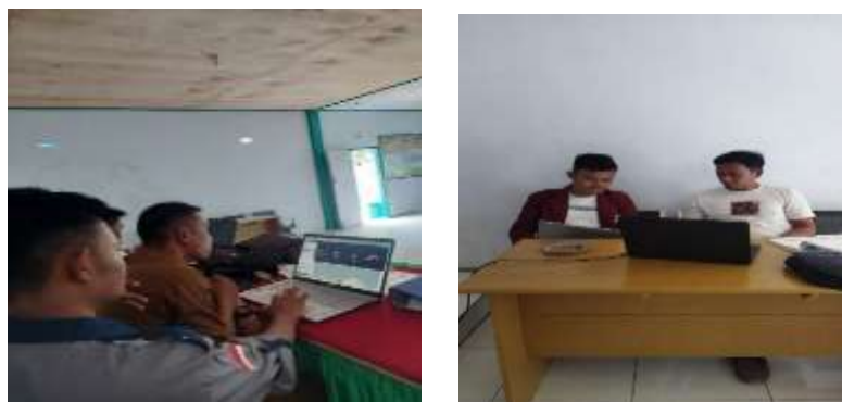
Gambar 2. Perkenalan tentang web desa