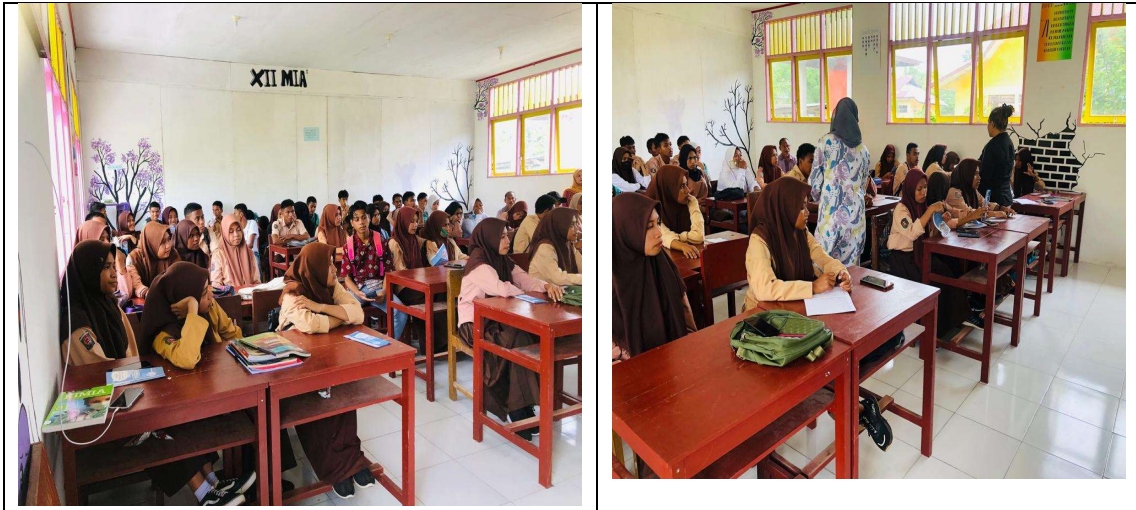
Gambar 2. Pelaksanaan PkM

Laporan berisi kegiatan proses pelaksanaan sampai dengan target PkM yaitu siswa/siswi dapat meningkatkan sikap dan pengetahuan siswa sekolah dalam kehamilan pada remaja bagi Kesehatan.