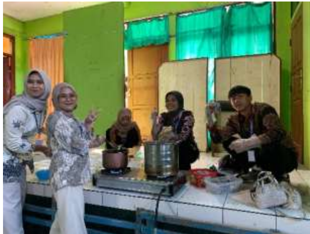
Gambar 5. Proses Perebusan Mie.

Setelah dicetak, mie kopi direbus dalam air mendidih hingga matang dengan waktu yang tepat. Peserta dilatih memperhatikan durasi perebusan agar mie tidak terlalu lembek atau keras. Hasil perebusan menunjukkan tekstur kenyal dengan warna kecokelatan dan aroma kopi yang khas. Pada tahap ini, mie siap digunakan sebagai bahan utama penyajian menu inovatif berbasis mie kopi.