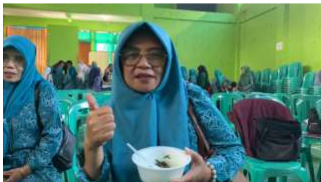
Gambar 10. Review Mie Kopi dari Ibu PKK.