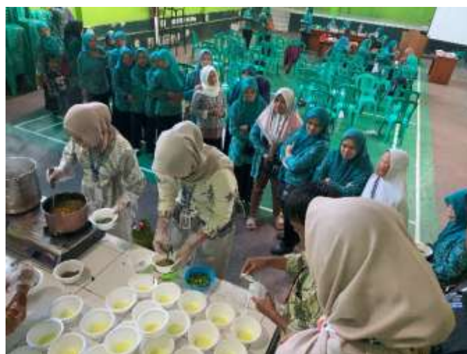
Gambar 11. Proses Pembagian Mie Kopi.

Pada gambar 11 Terlihat sekelompok ibu-ibu PKK sedang mengantri dengan tertib untuk mencoba inovasi kuliner berupa mie kopi. Suasana tampak ramai namun tetap teratur, menunjukkan antusiasme mereka terhadap produk baru tersebut. Di bagian depan antrian, terdapat meja tempat mie kopi disajikan, sehingga para ibu tampak penasaran sekaligus bersemangat menunggu giliran. Momen ini menggambarkan keterlibatan aktif masyarakat, khususnya ibu-ibu PKK, dalam mendukung program inovasi makanan berbasis lokal.