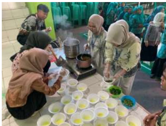
Gambar 6. Penyajian Mie Kopi.

Mie kopi yang telah matang kemudian disajikan menggunakan racikan bumbu mie ayam sebagai pelengkap. Tujuannya adalah memperlihatkan bagaimana mie kopi dapat dikombinasikan dengan resep kuliner populer sehingga memiliki daya tarik lebih besar bagi konsumen. Perpaduan rasa gurih bumbu ayam dengan aroma khas kopi menciptakan cita rasa unik yang berbeda dari mie konvensional. Penyajian ini juga menekankan bahwa mie kopi fleksibel untuk dikreasikan dengan berbagai jenis masakan sesuai selera pasar.