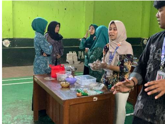
Gambar 3. Proses Menguleni Adonan Mie.

Setelah memahami bahan, peserta diajak melakukan pencampuran adonan mie dengan memasukkan bubuk kopi ke dalam campuran tepung, telur, dan air. Teknik menguleni hingga adonan kalis menjadi fokus utama agar tekstur mie tetap kenyal. Peserta belajar menyeimbangkan kelembekan dan kekerasan adonan sehingga hasil akhir tidak mudah patah. Pada tahap ini juga diberikan arahan bagaimana mengatur intensitas rasa kopi dalam adonan sesuai preferensi konsumen.