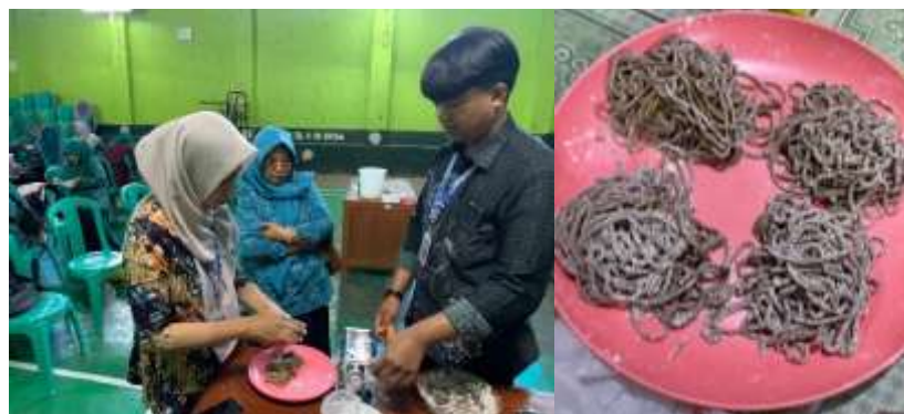
Gambar 4. Proses Pencetakan Mie Kopi.

Adonan kalis kemudian dipipihkan dan dipotong menggunakan alat pencetak mie sederhana. Peserta mencoba secara langsung untuk menghasilkan bentuk mie yang seragam dengan ketebalan yang sesuai. Teknik penaburan tepung pada hasil cetakan juga dipraktikkan agar untai mie tidak saling menempel. Proses ini memberikan pengalaman penting bagi peserta dalam menjaga mutu visual dan tekstur produk sebelum dimasak.