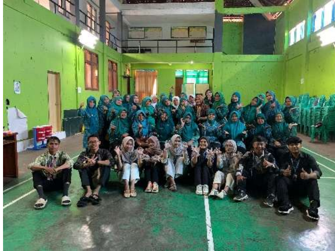
Gambar 8. Foto Bersama Menutup Kegiatan Workshop.

Selain menghasilkan produk pangan baru, kegiatan ini juga menimbulkan dampak sosial yang signifikan dalam kehidupan masyarakat. Sebelum program dijalankan, anggota PKK lebih banyak berkecukupan pada aktivitas rutin organisasi tanpa orientasi usaha kreatif. Setelah pelatihan, muncul kesadaran baru untuk mengembangkan kuliner berbasis inovasi, bahkan beberapa peserta mulai membentuk kelompok kecil untuk memproduksi mie kopi secara mandiri. Kelompok usaha ini berperan sebagai pranata sosial baru yang memperkuat solidaritas antaranggota sekaligus menjadi sarana pemberdayaan ekonomi. Kondisi ini sejalan dengan laporan (Murti et al. 2023) dalam To Maega: Jurnal Pengabdian Masyarakat , yang menekankan bahwa pelatihan kuliner berbasis bahan lokal mampu meningkatkan keterampilan sekaligus mendorong tumbuhnya inisiatif usaha di tingkat komunitas.