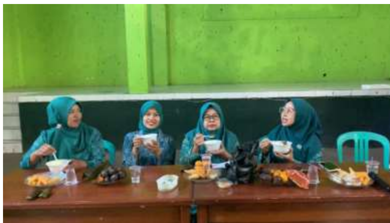
Gambar 7. Ibu PKK Mencoba Mie Kopi.

Tahap terakhir adalah sesi mencoba sajian mie kopi, setiap peserta diberi 1 porsi mie kopi untuk kemudian memberikan tanggapan mengenai rasa, tekstur, aroma, serta potensi pengembangan produk sebagai usaha kuliner lokal. Sebagian besar peserta menilai mie kopi enak, unik, dan berpotensi dipasarkan sebagai produk khas desa. Diskusi ini juga menjadi sarana evaluasi, dimana peserta menyampaikan ide untuk variasi rasa lain, desain kemasan, hingga strategi promosi. Dengan demikian, kegiatan tidak hanya menghasilkan produk uji coba, tetapi juga melahirkan masukan penting untuk pengembangan mie kopi di masa depan.