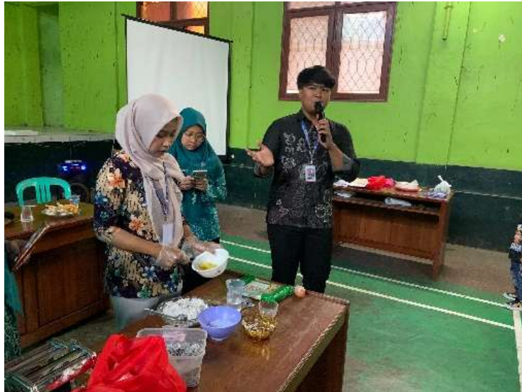
Gambar 2. Pemaparan Potensi Desa dan Pendemonstrasian Mie Kopi.

Kegiatan pelatihan pembuatan mie kopi berhasil meningkatkan keterampilan peserta dalam mengolah bahan dasar kopi menjadi produk pangan yang bernilai jual. Peserta dapat mempraktikkan teknik pembuatan mulai dari pencampuran adonan, pencetakan, hingga perebusan dengan hasil yang baik. Produk yang dihasilkan memiliki tekstur kenyal dengan aroma khas kopi, dan ketika diuji rasa dinilai enak serta menarik untuk dikembangkan lebih lanjut. Respon positif ini menegaskan bahwa mie kopi memiliki potensi untuk diterima oleh pasar yang lebih luas jika didukung strategi promosi dan pengemasan yang tepat. Hal ini sejalan dengan temuan (Pane 2022) yang menjelaskan bahwa mie kopi “Mikop” dapat diterima masyarakat sebagai produk inovatif dengan nilai kesehatan dan keunikan rasa. Selain itu, terdapat temuan lain yang sejalan mengemukakan bahwa mie kremes yang dibuat sawi hijau dan daun kersen memiliki kandungan nutrisi yang melimpah sehingga menarik minat masyarakat luas (Musyaffa Rafi Hidayat et al. 2024).