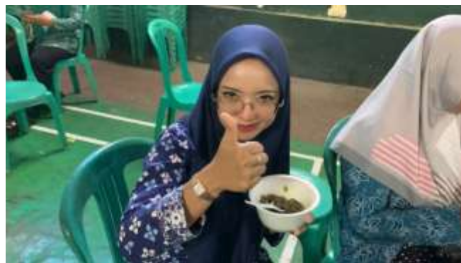
Gambar 9. Review Mie Kopi dari Ibu Perangkat Desa.

Kegiatan ini sudah di lakukan sesuai tahap yang di rencanakan dari awal pembuatan mie berbahan dasar kopi. Kegiatan ini di lakukan bersama masyarakat (Ibu Kader PKK) dan Mahasiswa. Pada Gambar 9 dan Gambar 10 adalah review dari hasil mencoba sajian mie kopi saat jalan nya kegiatan yang dilakukan pada saat kegiatan berlangsung.