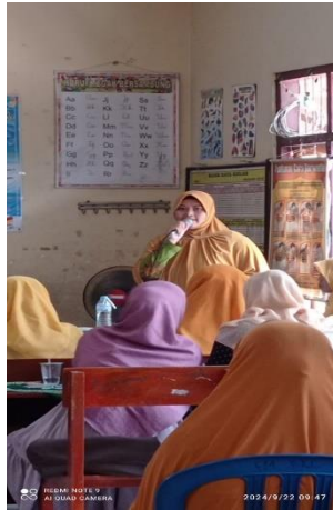
Gambar 2. Tahap pelaksanaan pelatihan Interaktif

pengabdian. Pelatihan dilakukan dalam bentuk kelas partisipatif yang menekankan dialog, simulasi kasus, kerja kelompok, dan praktik langsung. Materi disampaikan secara bertahap sesuai modul, dengan fasilitasi dari dosen pengabdi. Kegiatan ini tidak hanya bersifat teoritis, melainkan diarahkan untuk penguatan karakter kepemimpinan kader melalui refleksi nilai, pengalaman lapangan, dan keterampilan sosial. Tahap ini ditunjukkan pada gambar 2.