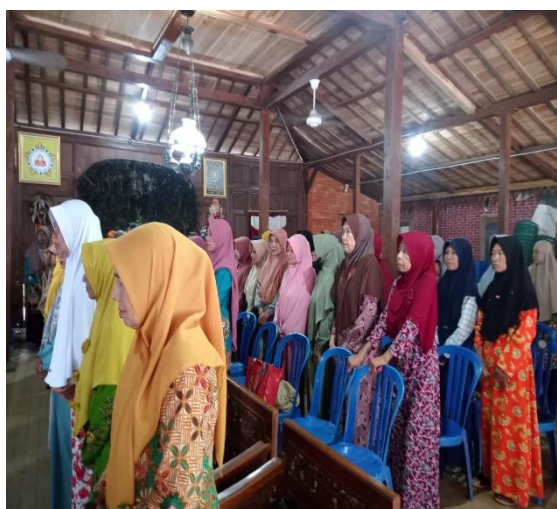
Gambar 3. Mitra melakukan kegiatan pada tahap Refleksi, Evaluasi, dan Umpan Balik

(4) Refleksi, Evaluasi, dan Umpan Balik , setelah pelatihan, peserta diarahkan untuk melakukan refleksi pribadi dan kelompok mengenai pengalaman belajar yang diperoleh, tantangan yang mereka hadapi, dan bagaimana mereka mengaitkan materi dengan konteks riil di komunitasnya. Evaluasi dilakukan melalui pre-test dan post-test sederhana serta penilaian performa selama pelatihan. Tim juga mengumpulkan umpan balik langsung dari peserta untuk mengukur efektivitas metode dan materi yang digunakan.