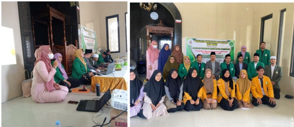
Gambar 1. Sosialisasi bimbingan konseling pesantren di Madrasah Aliyah BaytulMukarromah Watampone.

masalah kehidupan yang dialami oleh klien atau konseli, maka sudah sewajarnya konselor harus menjadi tauladan yang baik, agar klien merasa termotivasi dalam menyelesaikan masalah kehidupannya. Konselor Islami adalah seseorang yang memiliki kemampuan untuk melakukan konsultasi berdasarkan standar profesi. Konselor pada dasarnya tidak dapat melepaskan diri dari kelemahan-kelemahan yang dimilikinya dan selalu terikat dengan keadaan dirinya. Faktor kepribadian konselor menentukan corak pelayanan konseling yang dilakukannya dan dapat menentukan bentuk hubungan antara konselor dan konseli, bentuk kualitas penanganan masalah, dan pemilihan alternatif pemecahan masalah. Klien secara psikologis datang kepada konselor karena beberapa alasan diantaranya, keyakinan bahwa diri konselor lebih arif, lebih bijaksana, lebih mengetahui permasalahan, dan dapat juga dijadikan rujukan bagi penyelesaian masalah. Dalam memberikan sosialisasi bimbingan konseling pesantren, bahwa proses pemberian bantuan terhadap individu agar mampu hidup selaras dengan ketentuan dan petunjuk Allah SWT, sehingga dapat mencapai kebahagiaan hidup didunia dan diakhirat berdasarkan keimanan serta ketaqwaan yang terdapat dalam al-qur'an dan hadist. 21