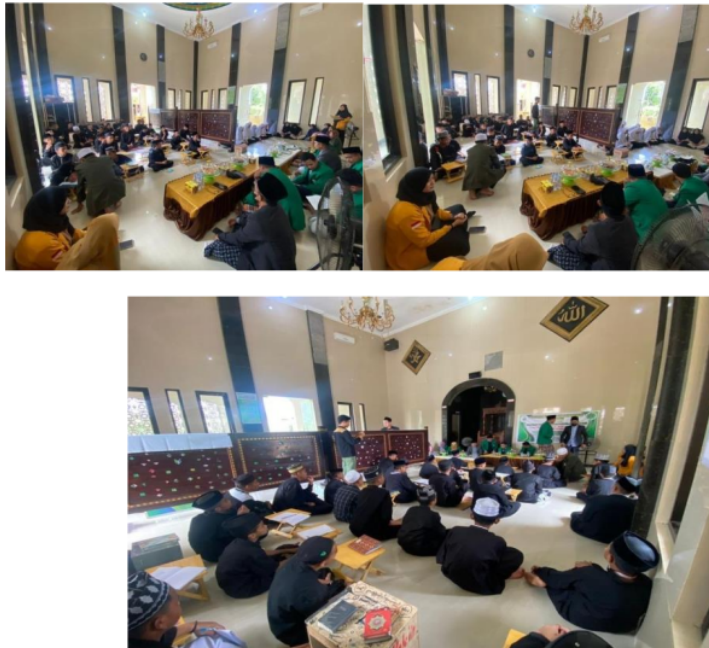
Gambar 2. Praktek penyusunan program bimbingan konseling pesantren sebagai penguatan karakter siswa Madrasah Aliyah Baytul Mukarromah Watampone.

Untuk dapat mewujudkan peserta didik yang berkarakter maka, guru bimbingan dan konseling 16 harus mempunyai strategi dalam membentuk karakter peserta didik, karena dengan menggunakan strategi dapat menghasilkan tujuan yang diinginkan dalam pendidikan. Agenda dalam program pengelolaan bimbingan konseling pesantren Madrasah Aliyah Baytul Mukarromah Watampone terdapat perencanaan, pengorganisasian, pelaksanaan, dan pengawasan. Perencanaan dilakukan setiap tahun di awal semester dengan membuat program layanan bimbingan konseling pesantren. Pengorganisasian melibatkan pihak madrasah dan pondok pesantren. Pelaksanaan bimbingan konseling pesantren dilakukan oleh guru bimbingan konseling pesantren dan dibantu oleh beberapa pihak baik madrasah maupun pondok pesantren. Untuk pelaksanaan ini masih terdapat banyak kendala sehingga layanan bimbingan konseling pesantren kurang efektif di Madrasah Aliyah Baytul Mukarromah Watampone. Sehingga perlu adanya sosialisasi bimbingan konseling pesantren dari pihak kampus dan tetap ada pengawasan bimbingan konseling pesantren yang dilakukan pada akhir semester oleh kepala madrasah dengan menitikberatkan pada perkembangan peserta didik pada tingkat kognitif, afektif, dan psikologis.