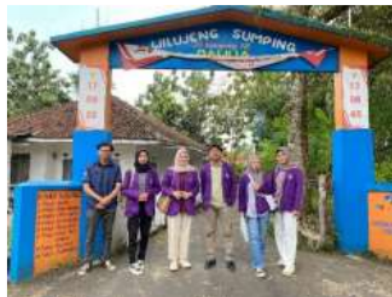
Gambar 3. Sosialisasi Peningkatan Program POKJA Kampung Keluarga Berkualitas (KB).