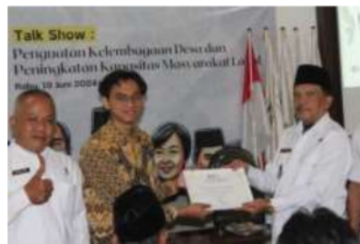
Gambar 2. Serah Terima Penghargaan Dari Mahasiswa Kepada Lembaga Pemerintah Desa Sadananya