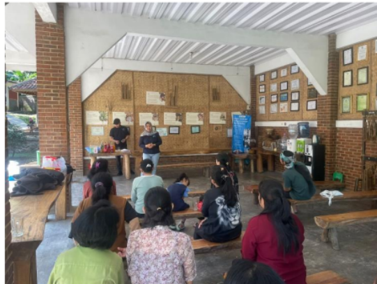
Gambar 4.1. Penyuluhan tentang pemanfaatan rempah sebagai Mocktail

Pengabdian Masyarakat ini tentunya telah melalui proses peninjauan dimana kami sebagai pelaku Pengabdian Masyarakat yakni Prodi Perhotelan Universitas Bina Sarana Informatika menawarkan kiranya kontribusi apa yang dapat kami berikan sebagai pihak akademisi untuk masyarakat Ciereundeu dan kiranya dapat membantu dari segi pemanfaatan yang ada di desa tersebut dan terlahirlah permintaan dari pihak mitra untuk mencari solusi kiranya bagaimana mengembangkan konsep minuman mocktail menggunakan bahan-bahan rempah dari wilayah lokal Desa Cireundeu. Diharapkan inisiatif ini tidak hanya meningkatkan Pendapatan masyarakat tetapi juga menginspirasi kreativitas dalam memanfaatkan potensi lokal untuk produk minuman yang inovatif sehingga dapat pula dimanfaatkan untuk perekonomian yakni bisa dijual kepada wisatawan yang datang ke desa adat tersebut.