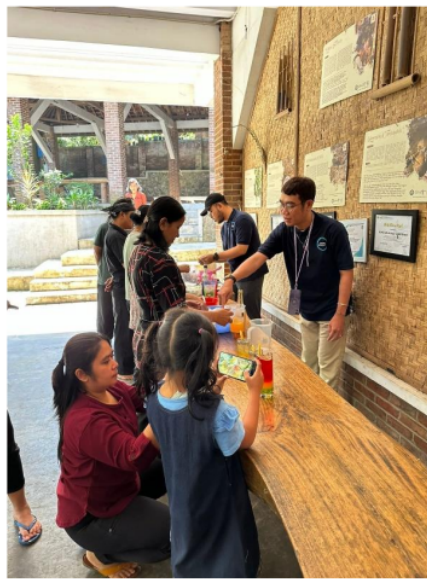
Gambar 4.3. Pembelajaran Bersama Pembuatan Mocktail