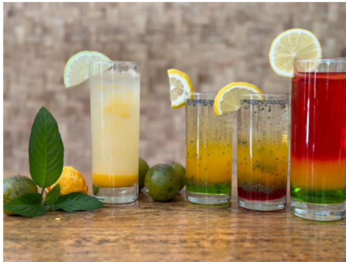
Gambar 4.4. Hasil Pembelajaran bersama

Pada gambar 4 adalah hasil pembuatan mocktail bersama Desa Adat Cierendeu dimana minuman ini dihasilkan dengan memanfaatkan rempah yang ada di sekitar sehingga nantinya dalam pengaplikasiannya dapat dengan mudah dan menjadi nilai jual yang lebih atau bervalue. Diharapkan melalui inovasi ini nantinya diharapkan dalam menarik minat wisatawan para penggiat di kampung adat cierendeu ini dapat menjual minuman mocktail yang kiranya menjadi cirikhas dari daerah cierendeu sendiri sehingga dari segi nilai dan harga dapat dirasakan oleh masyarakat.