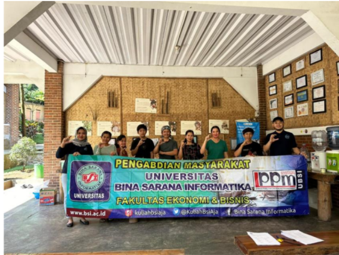
Gambar 4.2. Foto bersama Peserta Pengenalan Manfaat Rempah sebagai bahan mocktail