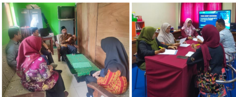
Gambar 2. Dokumentasi Kegiatan Observasi dan FGD

7 Pada kegiatan praktik penyusunan dokumen roadmap perencanaan strategis untuk pengembangan sistem informasi dan teknologi informasi bagi yayasan KM3 NU Ponorogo para peserta sangat antusias, walaupun beberapa peserta mengalami kendala diantara masih ada 2 peserta yang kesulitan untuk mengoperasikan Microsoft Office, namun dapat diatasi dengan terus diberikan pendampingan oleh tim pengabdian Masyarakat mahasiswa selama proses pembuatan dokumen. Praktik dilaksanakan dengan membentuk kelompok yang terdiri atas 2 peserta untuk per satu kelompok. Peserta akan diberikan arahan untuk membuat dokumen sesuai template yang diberikan oleh pelatih yaitu tim dosen. Praktik menghasilkan 3 dokumen roadmap yang kemudian 3 dokumen ini di diskusikan dalam kegiatan FGD bersama pimpinan untuk kemudian diambil keputusan terkait prioritas pengembangan sistem informasi dan infrastruktur teknologi informasi pada yayasan KM3 NU Pronorogo. Tim pengabdian masyarakat melakukan pendampingan dan memberikan masukan dalam penentuan prioritas selama proses FGD. Hasil akhir kegiatan adalah pelaksanaan pre-test bagi peserta pelatihan dan dokumen roadmap berisi prioritas pengembangan yang sudah disepakati pada saat FGD. 12 Adapun dokumentasi kegiatan dapat dilihat pada gambar 2 dibawah ini