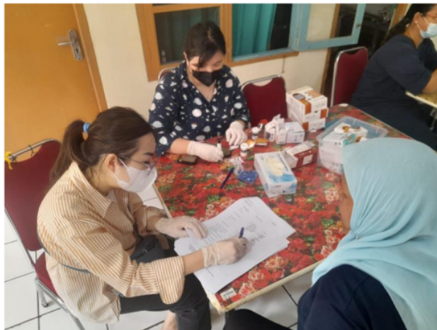
Gambar 3. Kegiatan PKM meliputi anamnesis, pemeriksaan fisik, dan penunjang

Program pengabdian masyarakat ini dilakukan dengan melaksanakan program edukasi dan skrining urin lengkap yang bertujuan untuk meningkatkan kesadaran masyarakat terhadap infeksi saluran kemih (ISK) pada lanjut usia. Program edukasi memberikan informasi penting mengenai gejala, faktor risiko, dan langkah-langkah pencegahan ISK kepada lanjut usia,