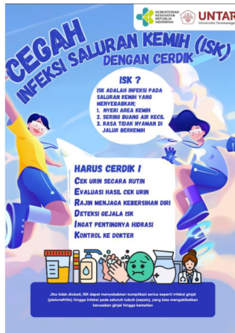
8 Gambar 2. Poster edukasi parameter kepada lanjut usia