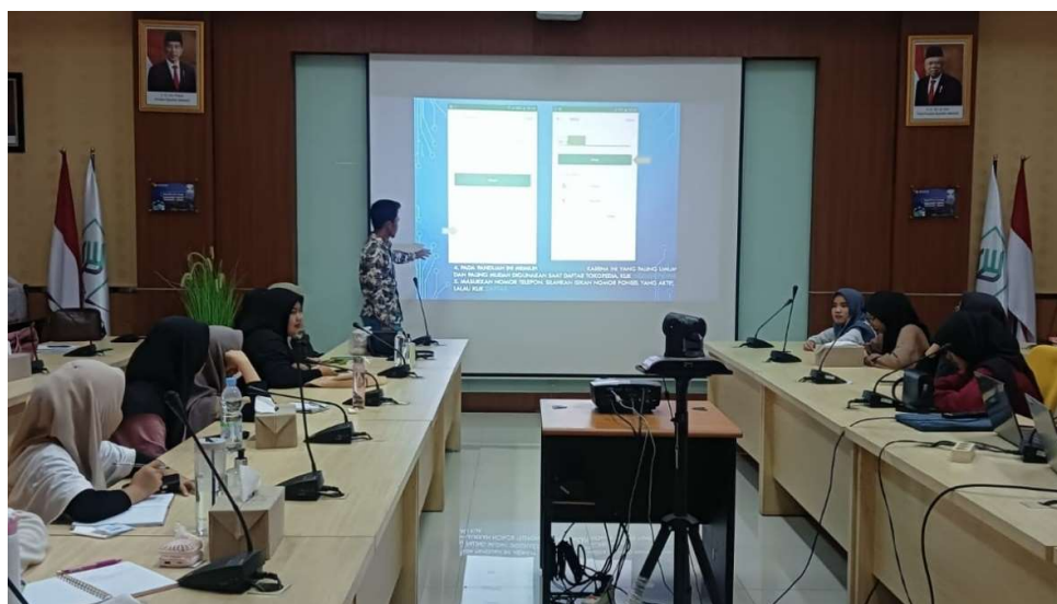
Gambar 4. Kegiatan pemberian materi oleh tutor

Kegiatan pengabdian masyarakat tentang penggunaan aplikasi marketplace Tokopedia dilakukan dengan mitra UMKM Siengkong TapiOk Bogor. Kegiatan dimulai pada pukul 09:00 WIB hingga selesai, Minggu, 19 Mei 20224 kegiatan pengabdian masyarakat ini dilaksanakan secara luring di Balai Besar Standarisasi Instrumen Pertanian Pascapanen (Aula KPRI BRIN). Peserta pengabdian masyarakat adalah Pengurus dan anggota UMKM Siengkong TapiOk Bogor. Selama kegiatan berlangsung diikuti dengan penuh semangat dan antusias oleh peserta pengabdian masyarakat, hal ini terlihat dari keseluruhan peserta banyak yang bertanya pada saat pemberian materi dan Latihan membuat toko online pada media Tokopedia. UMKM Siengkong TapiOk sendiri berada Jalan Tentara Pelajar Jl. Cimanggu Barata No.12 A, RT.01/RW.11, Cibogor, Kecamatan Bogor Tengah, Kota Bogor, Jawa Barat 16122.