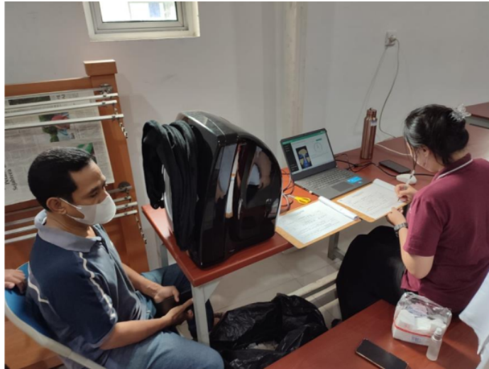
Gambar 2 Proses Pelaksanaan Skin Analyzer