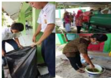
Gambar 4. Kegiatan cinta lingkungan dengan memilah sampah dan kunjungan pengolahan sampah menjadi pupuk

Program penguatan pendidikan karakter selanjutnya yang dilakukan di SMP Negeri 4 Padak yaitu kegiatan cinta lingkungan. Pada program ini, kegiatan yang dilakukan antara lain melakukan kegiatan pilah sampah dan pengelolaannya serta kunjungan pengolahan sampah, untuk diolah menjadi pupuk.