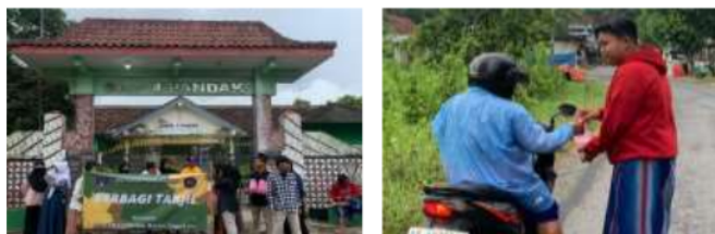
Gambar 2. Kegiatan bina iman dengan berbagi takjil di bulan Ramadhan

Pada program kegiatan bina iman, beberapa hal yang dilakukan yaitu: a) pembinaan iman dan taqwa di sekolah, seperti tadarus Al-Quran, membaca asmaul husna (bagi yang beragama Islam) maupun membaca dan merenungkan Alkitab (bagi yang beragama Kristen dan Katolik) yang dilaksanakan pagi hari sebelum kegiatan belajar dimulai, b) pembiasaan solat Dzuhur berjamaah di lingkungan mushola sekolah, c) Pembagian takjil di bulan Ramadhan, dan d) Menggandakan Al Qur'an bagi setiap siswa dari donator dan sudah terkumpul 471 Al-Qur'an yang digunakan untuk tadarus setiap hari Selasa, Rabu dan Kamis, selain itu juga pengadaan kitab suci untuk siswa beragama katolik dan Kristen.