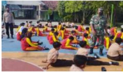
Gambar 3. Pembinaan mental dan jasmani siswa

Program penguatan Pendidikan karakter lain yang dilakukan yaitu pembinaan mental dan jasmani. Kegiatan ini dilakukan dengan membekali peserta didik dengan kegiatan olah raga dan penyuluhan yang dilakukan oleh Polsek dan Koramil Kapanewon Pandak untuk menguatkan mental peserta didik. Kegiatan bina jasmani dan mental dilaksanakan 3 kali sebulan yang diisi langsung dari Polsek dan Koramil Kapanewon Pandak.