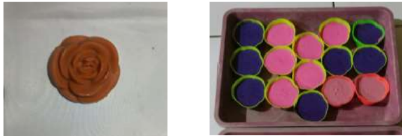
Gambar 5. Produk Sabun Hasil Pelatihan

Pada saat evaluasi mayoritas peserta sudah memahami baik dari materi disampaikan maupun dari praktik yang dilakukan selama pelatihan pembuatan sabun dilakukan. Dengan dilakukannya pelatihan ini diharapkan dengan adanya bekal ilmu yang telah diberikan baik ibu-ibu maupun masyarakat sekitar tidak lagi membuang minyak jelantah secara sembarangan melainkan dapat ditampung untuk kemudian dapat diolah kembali menjadi sabun yang bermanfaat untuk memenuhi kebutuhan rumah tangga sehari-hari.