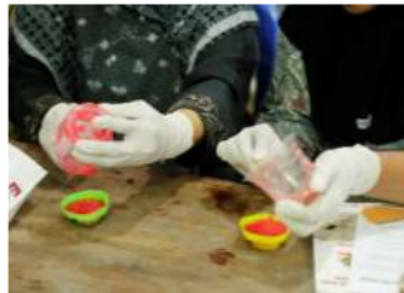
Gambar 4. Kegiatan Praktik Pembuatan Sabun

Dalam praktik pembuatan sabun, masing-masing peserta diberikan bahan-bahan yang diperlukan dalam pembuatan sabun. Selama proses pelatihan berlangsung peserta mendengarkan dan memerhatikan dengan saksama langkah kerja yang disampaikan oleh pemateri. Peserta dengan sangat antusias mengikuti arahan dan instruksi yang disampaikan oleh pemateri di depan. Peserta juga mengakui sangat dengan diadakannya pelatihan ini karena