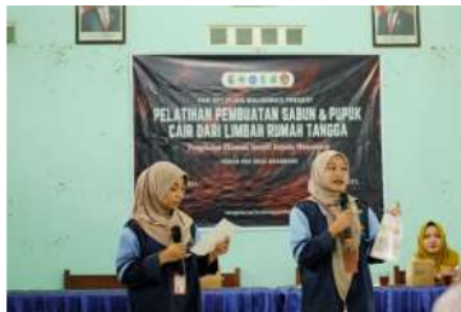
Gambar 3. Penyampaian Materi Mengenai Pentingnya Pemanfaatan Limbah

Setelah dilakukan edukasi dan penyuluhan mengenai manfaat dan bahaya minyak jelantah, tentunya perlu dilakukan tindak lanjut daur ulang limbah berupa praktik langsung pengolahan sabun bersama ibu-ibu dengan harapan nantinya mereka dapat menerapkan dan membuat sendiri dirumah. Hal ini dilakukan karena banyak pelestari lingkungan yang juga melakukan daur ulang limbah, namun tak jarang justru upaya tersebut hanya membuat sampah kembali dalam bentuk 11 lain dan nantinya hanya akan memperpanjang umur limbah (Prabasari and Rineksane 2023). Minyak jelantah dapat dibuat menjadi sabun baik dalam bentuk padat maupun cair. Sabun ini dapat digunakan sebagai sabun cuci piring maupun sabun untuk pembersih pakaian.