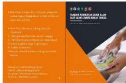
11 Gambar 2. Prosedur Pembuatan Sabun dari Minyak Jelantah

Sebelum dilakukan pelatihan dan praktik pengolahan pembuatan sabun, terlebih dahulu dilakukan edukasi dan penyuluhan dalam upaya meningkatkan pengetahuan ibu-ibu terkait manfaat dan bahaya minyak jelantah. Dalam sesi pemaparan materi, ibu-ibu juga diberikan brosur yang berisi materi manfaat dan bahaya minyak jelantah serta berisi panduan pembuatan sabun tersebut.