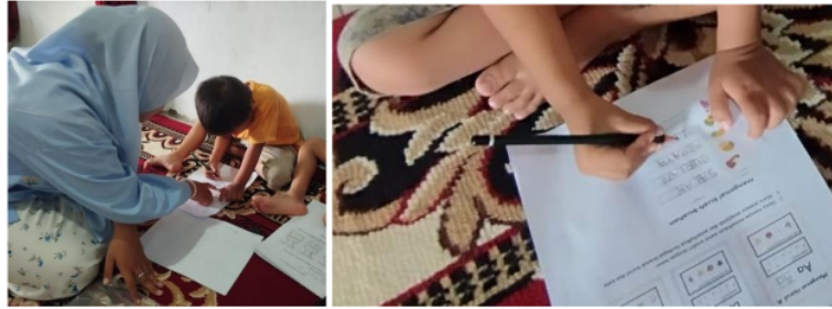
Gambar 5. Dokumentasi siswa AR (2024)

AR sudah mampu menulis namanya dengan benar. Dalam menulis permulaan, AR sudah mampu meniru lambang huruf dengan baik, sudah mampu menulis kalimat sederhana dan tulisannya sudah rapi, namun cara memegang pensilnya salah. (memenuhi tiga kriteria)