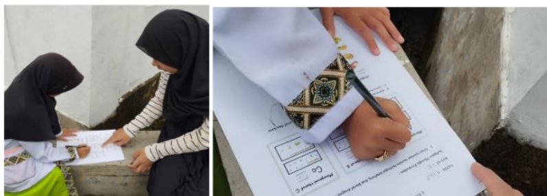
Gambar 1. Dokumentasi siswa CK (2024)

CK sudah mampu menulis namanya dengan benar. Berdasarkan soal latihan yang diberikan, CK sudah mampu meniru lambang huruf dengan baik, cara memegang pensil sudah benar dan tulisannya sudah rapi, namun dalam menulis kalimat sederhana masih banyak suku kata yang tertinggal oleh CK. (memenuhi empat kriteria)