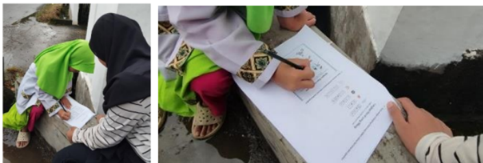
Gambar 3. Dokumentasi siswa KL (2024)

KL sudah mampu menulis namanya dengan benar. KL sudah mampu meniru maupun menjiplak lambang huruf pada gambar yang tertera. KL juga mampu membuat kalimat sederhana. Tulisan KL juga sudah rapi, namun ukurannya masih kurang kecil. Cara memegang pensil sudah benar. (memenuhi empat kriteria)