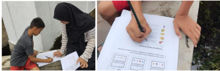
Gambar 2. Dokumentasi siswa NV (2024)