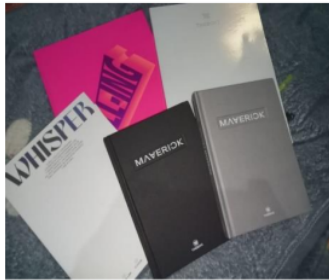
Gambar 3. Album

dari Rp 350.000,00 hingga Rp 850.000,00. Meski harganya cukup mahal, para remaja penggemar budaya K-Pop Korea tetap membeli dan mengoleksi barang-barang koleksi tersebut karena membawa kegembiraan. Salah satu informan menjelaskan bahwa ia suka mengoleksi benda-benda dan menganggap koleksinya berharga.