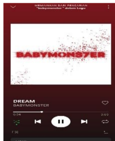
Gambar 2. Spotify lagu Baby Monstrer