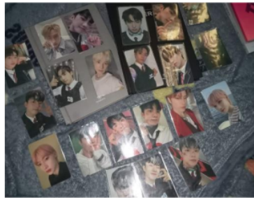
Gambar 4. Photocard