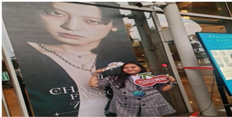
Gambar 5. Fanmeeting Idol K-Pop EXO di Jakarta

Selain konser, para penggemar K-Pop juga berusaha melihat idolanya secara langsung melalui acara fansign . acara fansign atau fansign merupakan acara dimana para penggemar K-pop dapat bertemu langsung dengan idolanya dan mendapatkan tanda tangan. Acara ini biasanya diadakan oleh agensi bakat dan promotor konser untuk mempromosikan album dan single baru grup K-pop. Acara fansign ini memberikan kesempatan kepada para penggemar untuk bertemu dan berinteraksi langsung dengan idolanya meski hanya dalam waktu singkat.