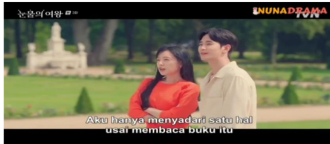
Gambar 6. Viu Drama Korea