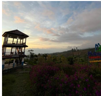
Gambar 1. Suasana Alam Desa Gubugklakah

Pokdarwis Gubugklakah juga tidak hanya fokus pada pengembangan aspek ekonomi pariwisata saja, tetapi juga mengedepankan kesadaran akan pentingnya pelestarian alam dan budaya. Dalam hal ini, mereka mengintegrasikan konsep eco-tourism yang menekankan pada pelestarian sumber daya alam dan budaya sebagai bagian dari daya tarik wisata (Salsabila & Puspitasari, 2023). Sebagai contoh, mereka mengembangkan wisata berbasis alam seperti trekking di kawasan hutan dan perbukitan, serta wisata edukasi pertanian yang mengajak pengunjung untuk mengenal lebih dalam tentang cara bertani secara organik. Dengan pendekatan ini, Pokdarwis Gubugklakah turut serta menjaga keseimbangan antara eksploitasi pariwisata dan pelestarian lingkungan.