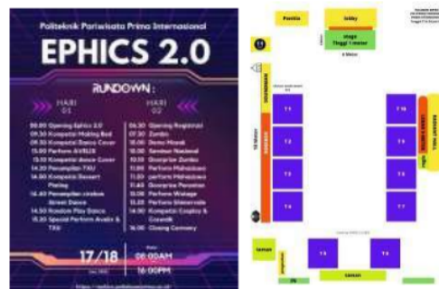
Gambar 4.1 Layout Acara dan Rundown Acara

Proyek lanjutan dari EPHICS 1.0 yaitu EPHICS 2.0 yang bertema All in One yang bermakna bahwa segala aspek yang terlibat menjadi satu kesatuan untuk tujuan bersama yang bermakna. Terselenggara kegiatan EPHICS bukan hanya murni dari ide dan aksi mahasiswa di dalamnya, tapi juga kolaborasi mahasiswa dengan berbagai praktisi di bidang Event Management sehingga terbentuk lah berbagai program menarik dalam event EPHICS ini. Tahap awal penyelenggaraan EPHICS 2.0 dilakukan dengan perencanaan yang dilakukan oleh kepanitiaan dari mahasiswa/i Politeknik Pariwisata Prima Internasional dengan melakukan rapat angkatan. Pada rapat angkatan ini dilakukanlah perencanaan konsep dan merancang pembuatan proposal acara EPHICS 2.0 yang nantinya diperlukan untuk memperoleh pendanaan. Setelah konsep acara terbentuk, maka konsep yang telah disepakati mahasiswa diajukan kepada pihak management kampus untuk meninjau dan membantu melakukan penyempurnaan. Setelah disetujui oleh pihak kampus, maka dirancanglah beberapa hal seperti pembuatan layout , penyusunan rundown acara, pengumpulan dana melalui sponsorship dan berwirausaha, publikasi acara dengan penyebaran flyer baik melalui media sosial maupun secara langsung, dengan face to face . Contoh dari layout yang telah dibuat adalah sebagai berikut: