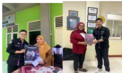
Gambar 4.2 Penyebaran flyer dan sponsorship EPHICS

Segala jenis tindakan yang merujuk pada sebuah fakta, hingga melahirkan suatu gambaran dan formulasi asumsi masa depan, merupakan sebuah perencanaan atau planning . Proses perencanaan diawali dengan menentukan tujuan sebuah acara, Setelah tujuan terbentuk, maka selanjutnya dibentuklah panitia dan diskusi rapat besar untuk menentukan konsep yang dibutuhkan dalam acara EPHICS 2.0 ini. Setelah konsep acara terbentuk dan diajukan kepada pihak management kampus dan disetujui, maka dibuatlah layout , penyusunan rundown acara, pengumpulan dana melalui sponsorship dan berwirausaha, publikasi acara dengan penyebaran flyer baik melalui media sosial maupun secara langsung dengan face to face , dan tentunya dokumen proposal EPHICS 2.0 untuk diajukan pada para pihak sponsorship .