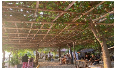
Gambar 3 Lokasi jualan di Pantai Sire

Fenomena air laut yang pasang surut tidak hanya menarik wisatawan akan tetapi memberikan peluang bagi para pedagang lokal untuk meningkatkan atau menawarkan jualan yang mereka perdagangkan. Pedagang di Pantai Sire pun menggunakan berbagai macam strategi untuk menarik minat wisatawan berkunjung ke kedainya. Berikut gambaran kondisi lapak jualan seperti dibawah ini: