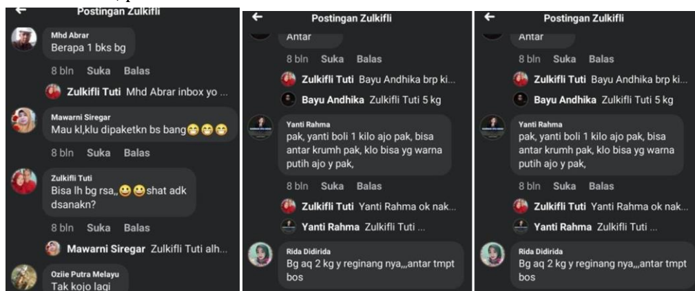
Gambar 4.11 Kolom Komentar Sosial Media Facebook Pemilik Usaha