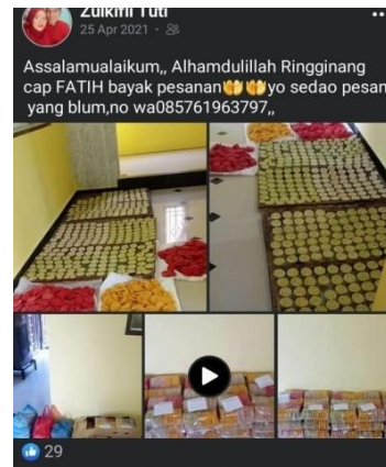
Gambar 4.10 Postingan Sosial Media Facebook Pemilik Usaha