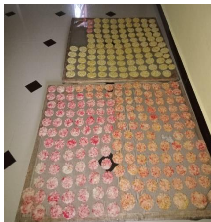
Gambar 4.1 Proses Penjemuran rengginang